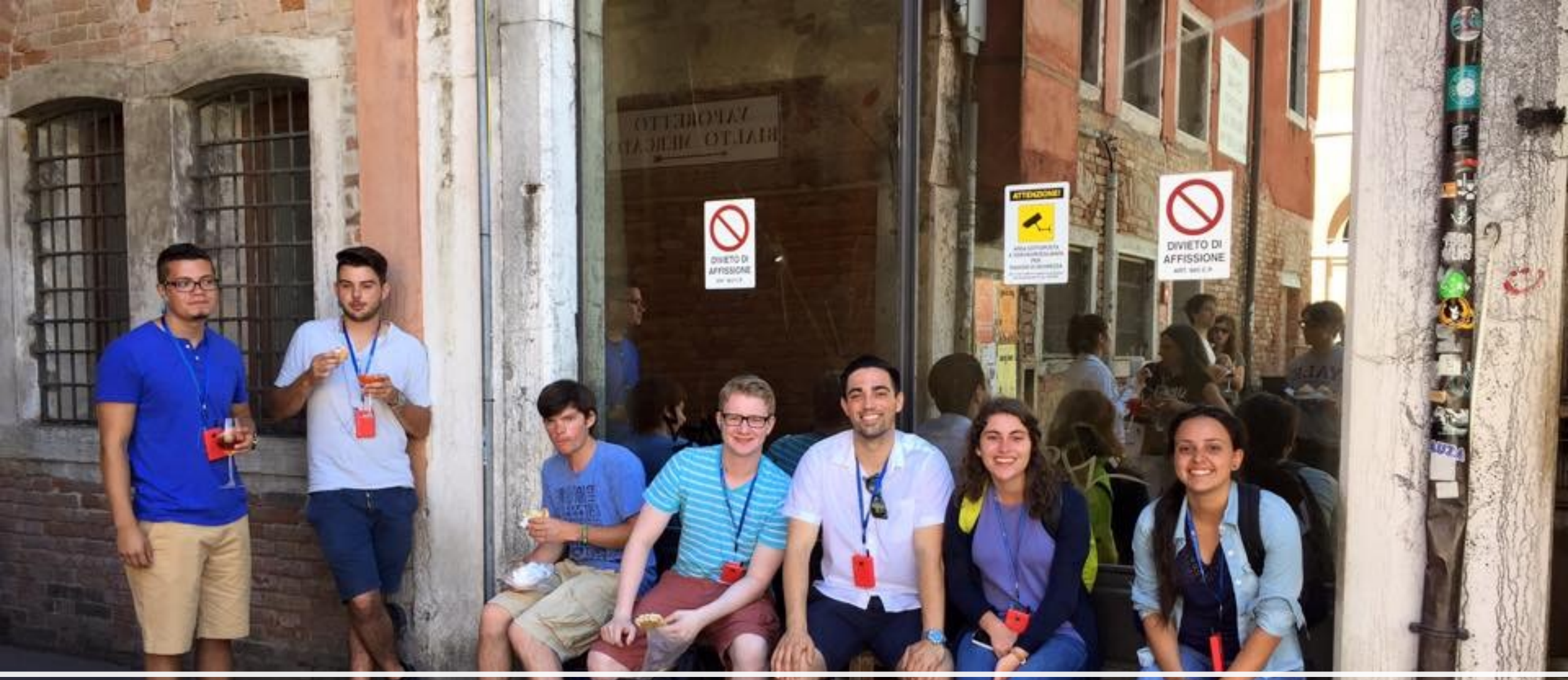
Momenti di incontro con gli altri volontari (2016)