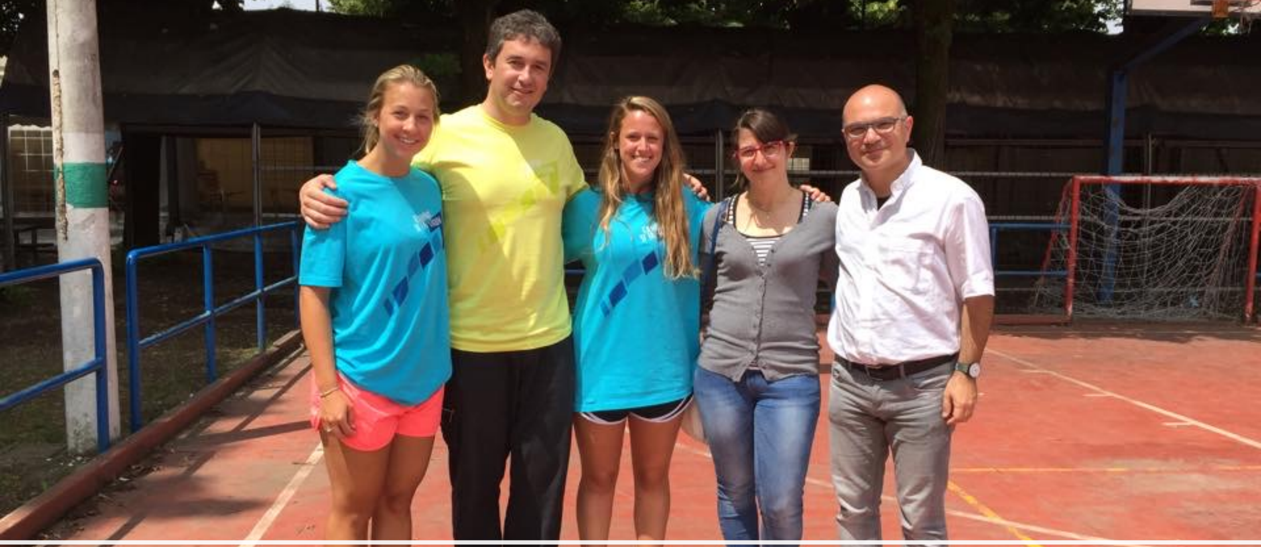
Il «gruppo» di Cesano Maderno (2016)